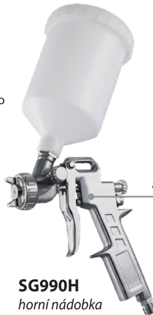
SG990H horní nádobka

Široký výběr tryskových kompletů pro použití s různě hustými nátěrovými hmotami