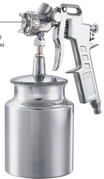
SG990S spodní nádobka

Regulace tvaru paprsku z kulatého na plochý a regulace přívodu barvy