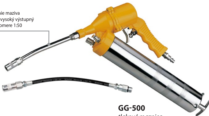
GG-500 tlaková maznica s dávkovaním maziva